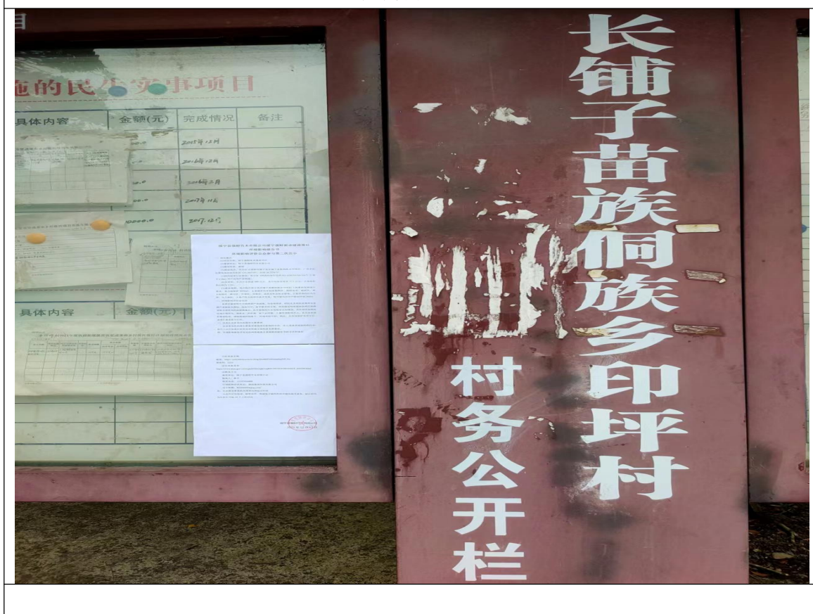
图 3-3 现场第二次公示