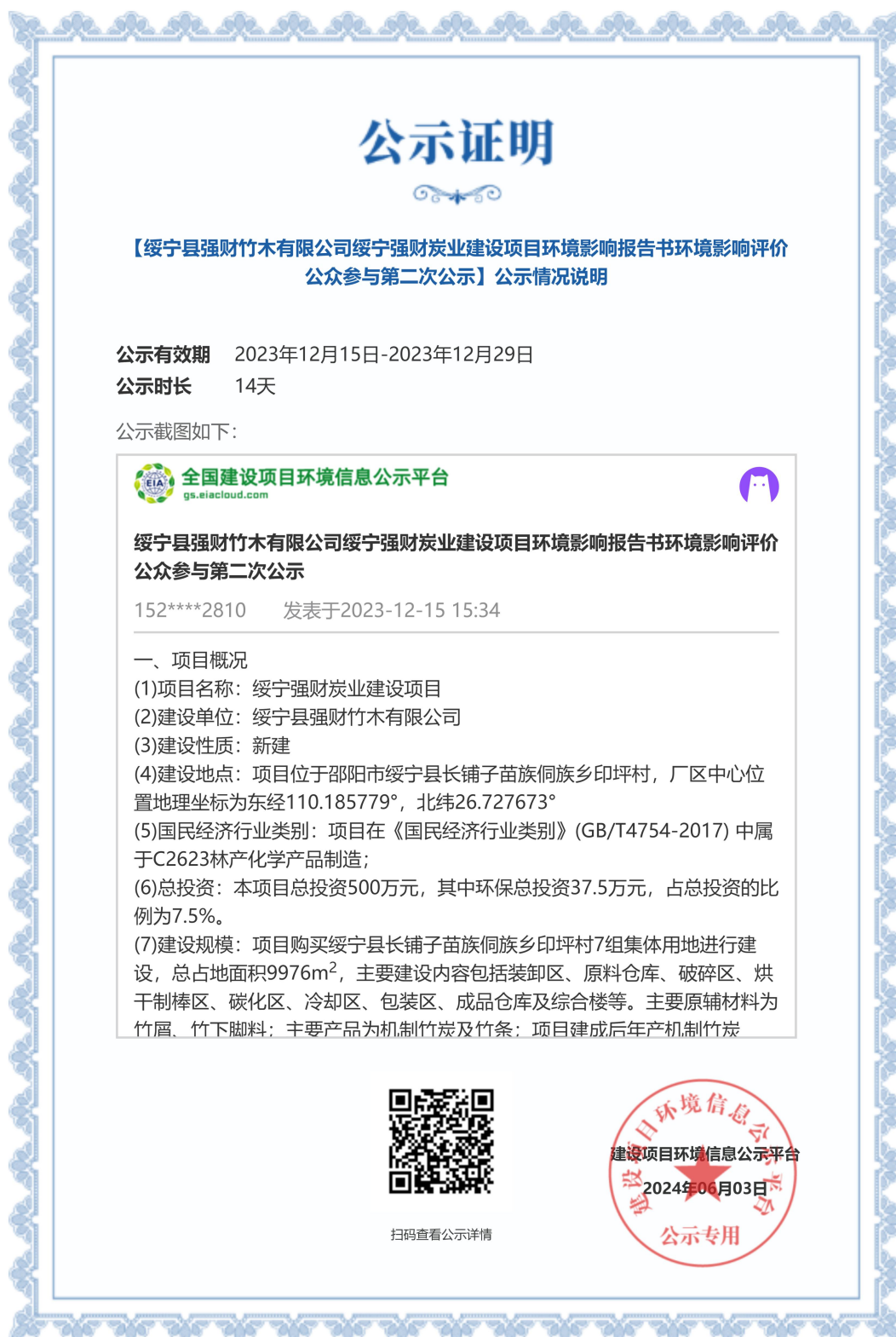
图 3-1 第二次网站公示截图