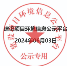
图2-1 第一次网站公示截图