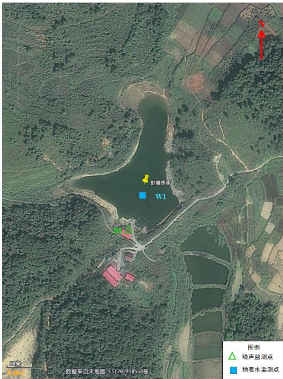
图 3-1 地表水监测断面布点图