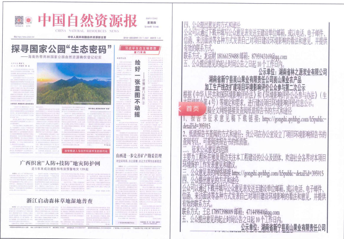
图 3 报纸第二次公示