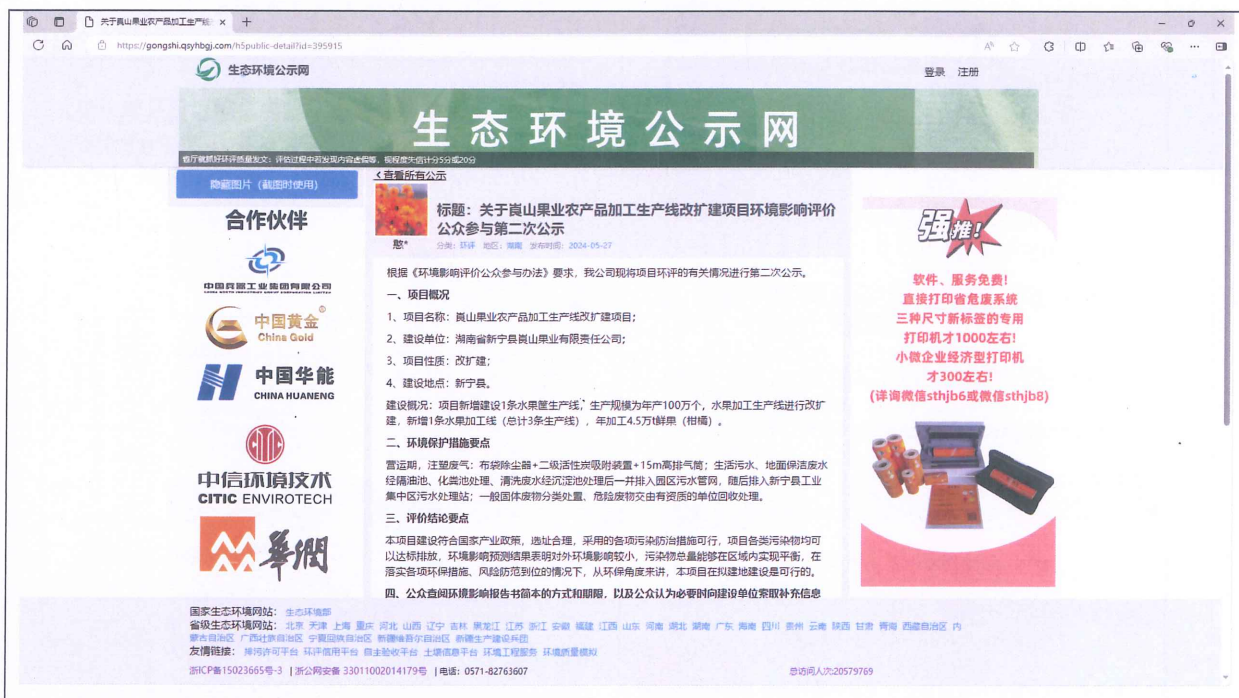
图 2 第二次网站公示截图

公示网址： https://gongshi.qsyhbgi.com/h5public-detail?id=395915